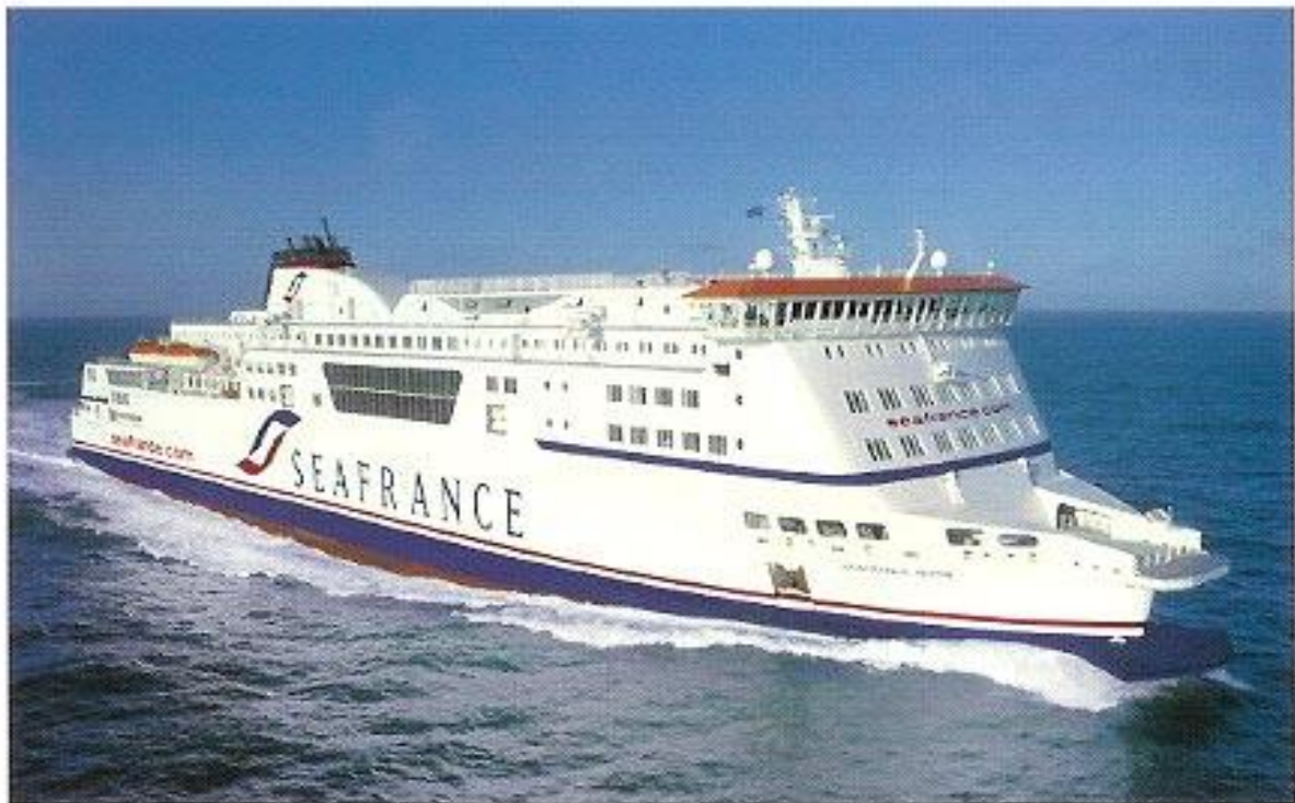
Le SeaFrance Rodin

Ce navire apporte un cadre qui ne laissera pas les gens présents insensibles.